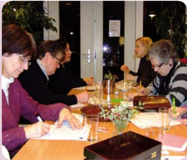
De dagelijkse dingen in Reek

telijke eindevaluatie. In 2010 zijn er nog acht themabijeenkomsten georganiseerd over 'Werk en Privé in balans' (2 keer), 'Zorg voor je (klein-)kinderen' (5 keer) en 'Vrijwilligerswerk' (1 keer). Informatie uit deze bijeenkomsten wordt gebruikt bij het opzetten van nieuwe projecten en thema's. Doel van het project was om bewustzijn te creëren onder vrouwen: welke keuzes maken zij in hun dagelijkse leven, hoeveel tijd nemen zij voor zichzelf en komen zij voldoende voor zichzelf op?