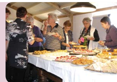
High Tea In Gilze

Op 1 januari 2010 werd het Buitengewoon Lidmaatschap geïntroduceerd. Doel is meer vrouwen de kans te bieden lid te worden of te blijven van de KVO. Het Buitengewoon Lidmaatschap is in het bijzonder opgericht voor vrouwen waarvan de eigen afdeling is opgeheven. Ook voor vrouwen die liever geen lid zijn van een afdeling, maar wel van de KVO, biedt dit type lidmaatschap uitkomst. Belangrijk is dat de vrouwen de doelstelling van de KVO onderschrijven. Buitengewone Leden ontvangen vier keer per jaar het ledenblad en kunnen deelnemen aan specifieke activiteiten en gebruikmaken van ledenacties (waaronder veel leuke kortingen). Kosten van het Buitengewoon Lidmaatschap zijn 25 euro per jaar.