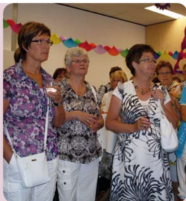
Opening KVO serviceburo

De KVO heeft een bezoek gebracht aan het Symposium over Mantelzorg, georganiseerd door BRIZ (Brabantse Raad voor Informele Zorg). Dit ter oriëntatie op het onderwerp 'informele zorg'. De KVO en BRIZ onderzoeken in 2011 de verdere mogelijkheden voor samenwerking.