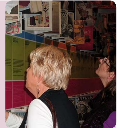
Bezoek Graphic Design Museum

(Ingekort bericht door Ondine van der Vleuten, journaliste PZC)