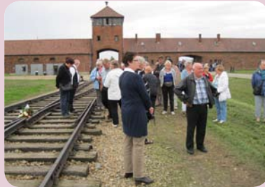
Bezoek aan Auschwitz