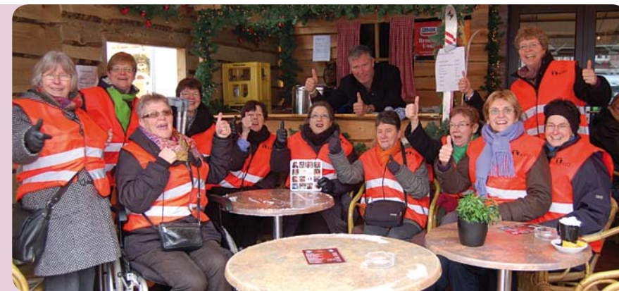
Actie 3FM Serious Request

Het jaarlijkse Euromuntje dat de KVO ieder jaar ter beschikking van een goed doel stelde, is in 2010 beëindigd met een actie voor 3FM