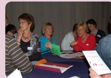
Ledenwervingsavond in Zundert