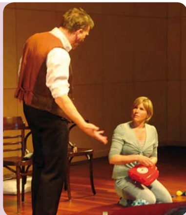
Doorbreek huiselijk geweld

De Nederlandse Vrouwen Raad heeft het project 'Help huiselijk geweld doorbreken!' opgezet in vier provincies. Het project in Brabant wordt uitgevoerd onder leiding van de PVR