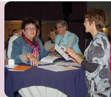
Ledenwerving in Zundert

Er is een nieuwe folder ontwikkeld die afdelingen kunnen uitdelen aan geïnteresseerde vrouwen. Alle afdelingen hebben recht op honderd gratis folders ter verspreiding. De folder is door de afdelingsbesturen enthousiast ontvangen en al veelvuldig gebruikt.