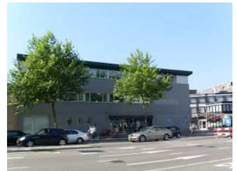
Nieuwe locatie: KVO-serviceburo

Voorlopig gebruiken we, zolang de voorraad strekt, onze oude vervolgpapier en enveloppen.